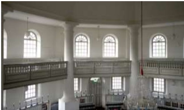
Interieur Koepelkerk - Veenhuizen

http://klavecijnist.wixsite.com/robert-koolstra