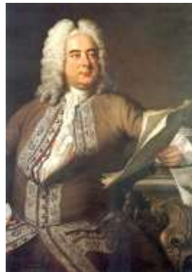
Georg Friedrich Händel