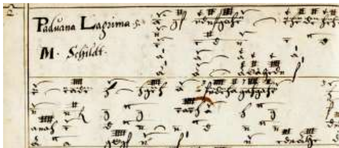
Fragment tabulatuur - Melchior Schildt