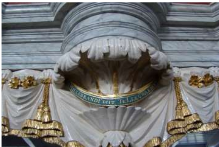
'Hillebrand Fecit Te Leeuwarden': in de Koepelkerk - Veenhuizen