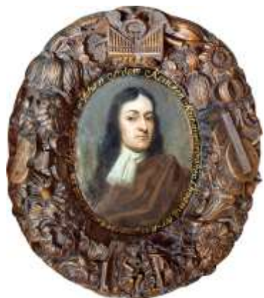
Johann Adam Reincken