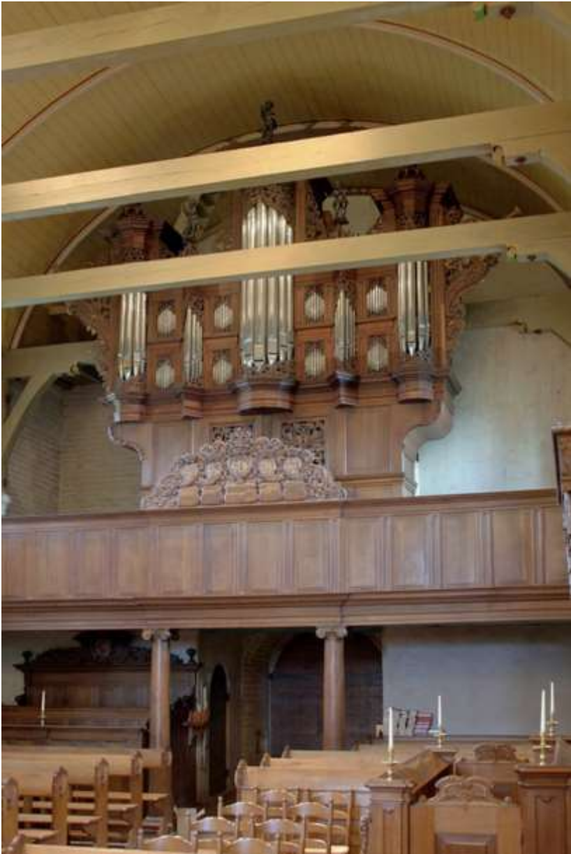
Het Schnitger-orgel Magnuskerk - Anloo