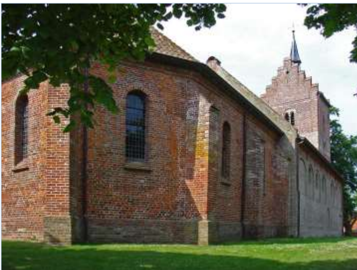
Magnuskerk - Anloo