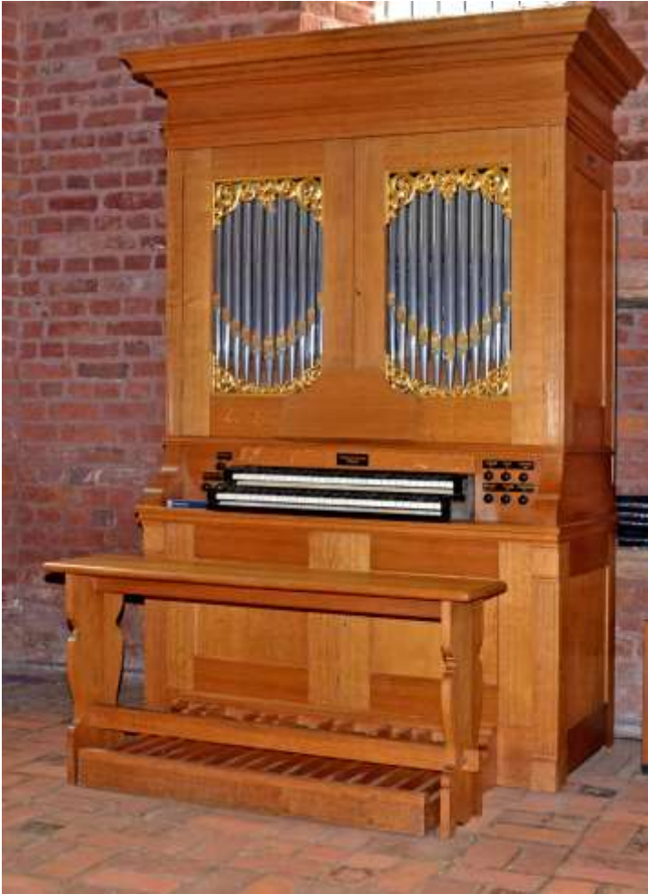
Van Vulpen-orgel Magnuskerk - Anloo