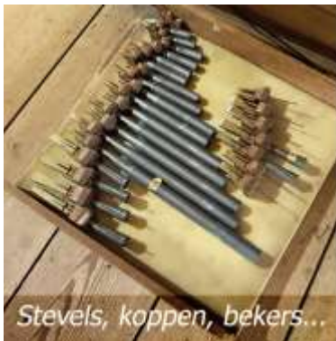
Stevens, koppen, bekers...